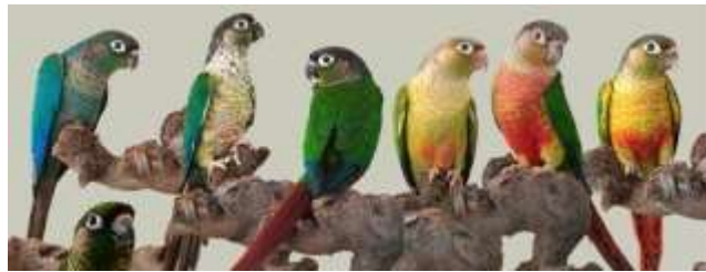
Il existe de nombreuses mutations de couleurs

Perroquet de taille moyenne à petite. Dans la nature, son plumage présente une prédominance verte, en particulier les joues. Sa poitrine arbore des écailles caractéristiques de couleur brun foncé et doré clair. Le front, la calotte, la nuque, le bec et les pattes sont noirs. Les rémiges sont bleues et les rectrices (plumes de la queue) rouge. Les cercles oculaires sont blancs et les iris marron.