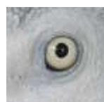
Adulte d'un an

C'est un perroquet trapu, entièrement gris à l'exception de la queue, rouge. Le front et les joues sont dépourvus de plumes et forment un masque blanc. Le bec massif est noir.