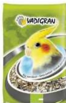
Mélange grande perruche