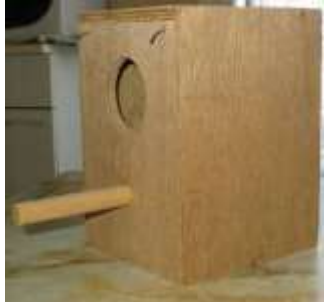
Nid fermé boîte