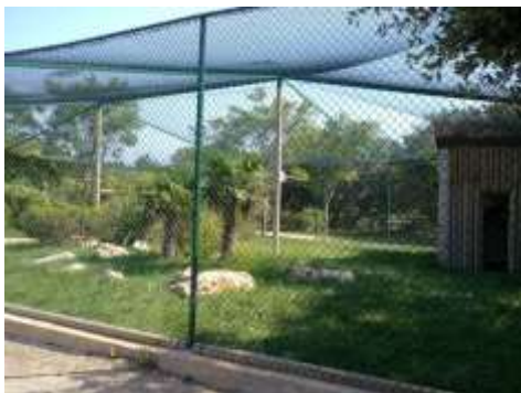
Le top – volière extérieur

Assez agressif en période de reproduction, la cohabitation avec des grandes perruches est possible (callopsitte par exemple) si la volière est assez spacieuse.