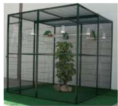
Volière intérieur 4 m2

Caractère : Cette perruche n'est pas très sociable avec d'autres espèces