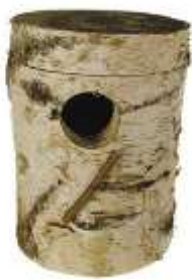
Nid buche ou nid tronc