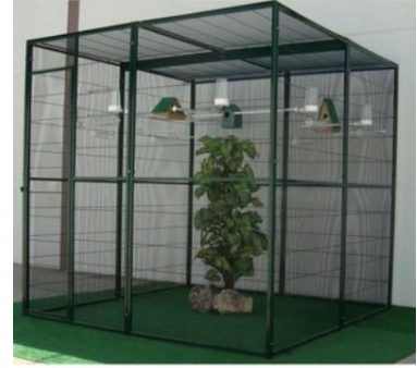
Volière intérieur 4 m2

Si l'oiseau sort de sa cage plusieurs heures par jour, la taille de la volière peut alors être plus modeste.