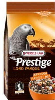
Mélange perroquets africains