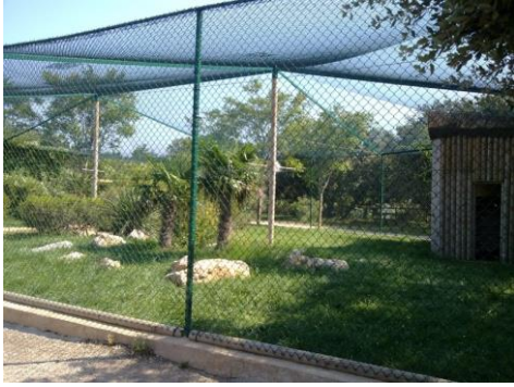
Le top – volière extérieur