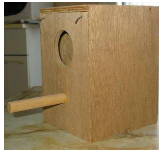
Nid buche ou nid tronc Nid fermé boite

Copeaux ou tourbes au fond du nid. La femelle va garnir le nid avec des matériaux glaner dans la volière (herbe, plume...).