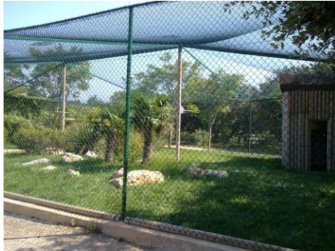
Le top – volière extérieur

Elles sont souvent vendues à des personnes qui vivent en appartement car elles ne crient pas comme certaines perruches (peu bruyante).