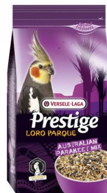
Mélange grands perruches Australiennes