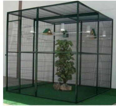
Volière intérieur 4 m2

Les EAM ou MAN ou EPP apprivoisé peuvent être élevé seul mais exigeront que l'on passe beaucoup de temps avec eux (3 heures/ jour par exemple). L'idéal est d'en avoir au moins 1 couple