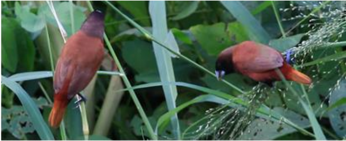
Lonchura dans leur milieu naturel

couper la fine veine visible par transparence