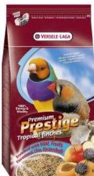
Mélange graines enrichi