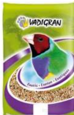
Mélange de graine