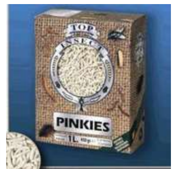
Insectes congelés Complément)

Dimorphisme sexuel : la femelle est plus terne, les joues des males sont plus colorées à l'âge adulte