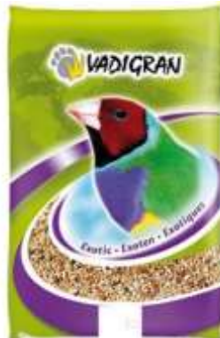
Mélange de graine