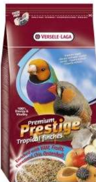
Mélange graines enrichi