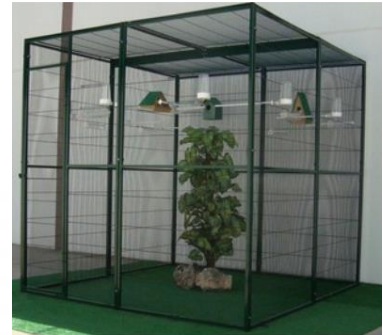
Volière intérieur 4 m2

Si l'oiseau sort de sa cage plusieurs heures par jour, la taille de la volière peut alors être plus modeste.