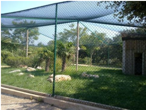
Le top – volière extérieur

Les perchoirs dans la cage seront de tailles différentes, et en bois. De nombreux jeux ou jouet lui seront proposés pour les distractions.