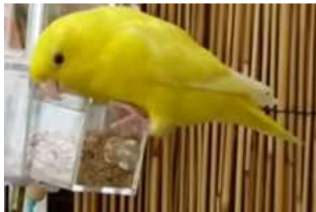
ino (anciennement lutino)